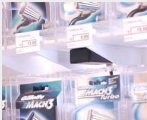
Gillett er en av mange som benytter seg av RFID for å spore varene. ( Klikk for større bilde )